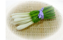
こちらでしょうか

「ウチのカメは中尾のKさん。18年生きています。え、そういう方も、でかいです。」と結構いらっしゃる。いつ中尾のNさんよつです。