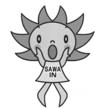
珍しい「チャー!」 のポーズ

毎号登場して、おなじみにな りましたさわインちゃんです。 バックナンバーを調べる方、帽 子をかぶっているのはおじぎポ ーズの中のひとつと考えてくださ いね。裏がえしもパターンで す。