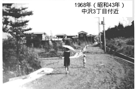
1968年(昭和43年) 中沢3丁目付近