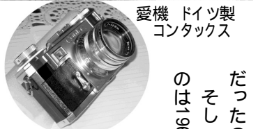
愛機 ドイツ製 コンタックス

だったのには驚いたそうです。そして平屋の家を建て引っ越したのは1968年(昭和43年)2月の寒い日でした。東京都内より一段寒い気候にも驚きました。当時は東急ニュータウンの中にバスがなく、試験場循環のバスだけでしたので中沢町のバス停まで歩きました。