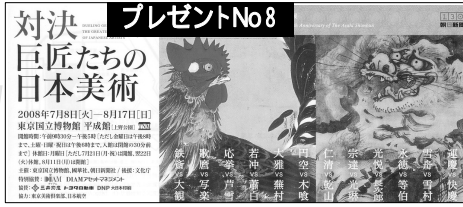
対決 巨匠たちの日本美術

2008年7月8日(火)～8月17日(日) 東京国立博物館 平成館 1階 9階 対決 巨匠たちの日本美術 2冊セット 対決 巨匠たちの日本美術 2冊セット 対決 巨匠たちの日本美術 2冊セット