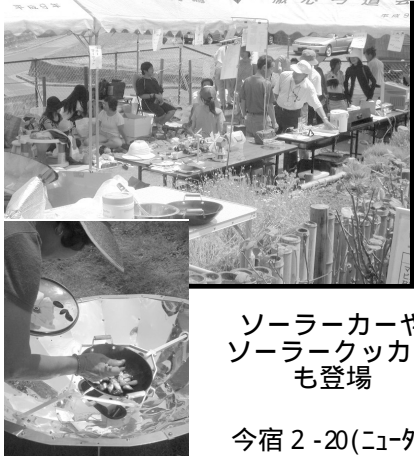
ソーラーカーや ソーラークッカー も登場

7月21日エコ笑こ祭りの様子 8月24日に今宿地区センターでの「今宿サマーフェスタ2008」にも参加します