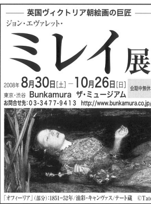
英国ヴィクトリア朝絵画の巨匠 ジョン・エヴァレット ミレイ展 2008年 8月30日(土) - 10月26日(日) 会期中無休 東京・渋谷 Bunkamura ザ・ミュージアム お問合せ先:03-3477-9413 http://www.bunkamura.co.jp/

中国製冷凍キョーザ事件やチベットの問題も解決されないまま北京五輪が開催されてしまいました。ガソリンや食料品の値上げ、身勝手な殺人事件や偽装問題、福田改造内閣も記憶が薄くなるくらい、北島選手を始め日本人選手の活躍ぶりには明るい話題の提供となりました。あと一週間ちよっと、無事に閉幕を迎えられるよう見守ってゆきたいと思っております。