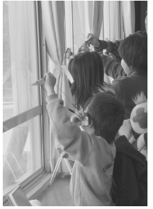
太陽電池で発電だ!

第一回目の参加人数より5名加わり、大賑わいの実験編。太陽光発電の仕組みも教えてもらいました。クイズ形式の紙芝居も、皆楽しく勉強出来たようです。