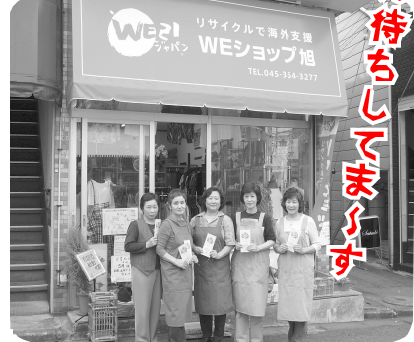
中希望が丘101-21日曜・祝祭日定休