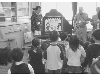
省エネ紙芝居<エコッコ隊>に見入る子供たち

環境まちづくり市民の会「サステイナブルあさひ」による 中沢小学校放課後キッズクラブでの地球温暖化課外授業 2回目