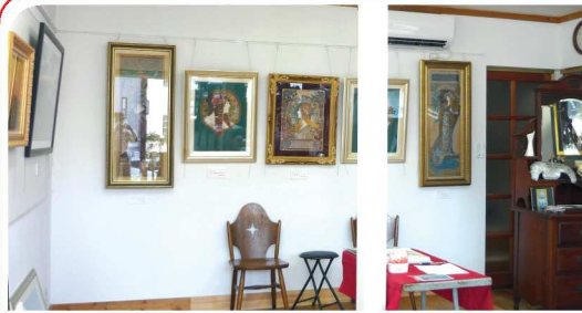
ミユシヤを模写しミシンで織った繊細な糸絵（ししゅう）作品等を展示中