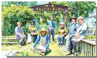
MONOCLEに掲載されている現地と皆さん